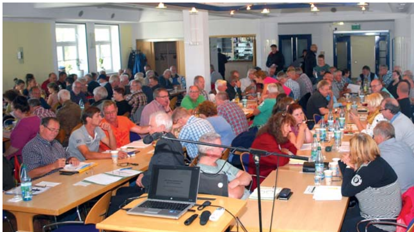
Über 200 Personen nahmen am Seminar des Stadtverbandes teil.

Unabhängig davon sind die KGV gut beraten, sich jetzt schon Gedanken darüber zu machen, was in den nächsten Jahren getan werden sollte, um ihren Verein im Sinne des „Masterplanes Grün Leipzig 2030“ zu einem „Leuchtturm“ werden zu lassen. gm