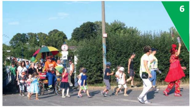
Umzüge sind eine gute Tradition in vielen KGV.