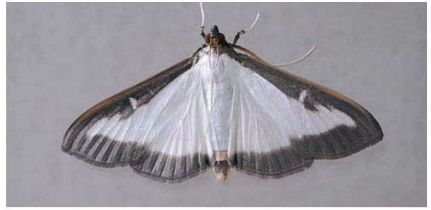
Der gefürchtete Buchsbaumzünsler als Raupe und erwachsener Schmetterling.