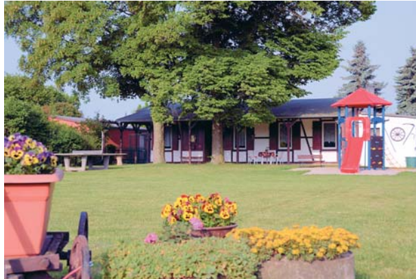
Die Vereinswiese mit Spielplatz und Vereinshaus.

Im KGV gab es ein buntes und vielfältiges Vereinsleben. Es wurden fast jeden Monat Feste gefeiert. Ab 1911 wurden Festumzüge organisiert, die vom vereinseigenen Trommler- und Pfeifenkorps