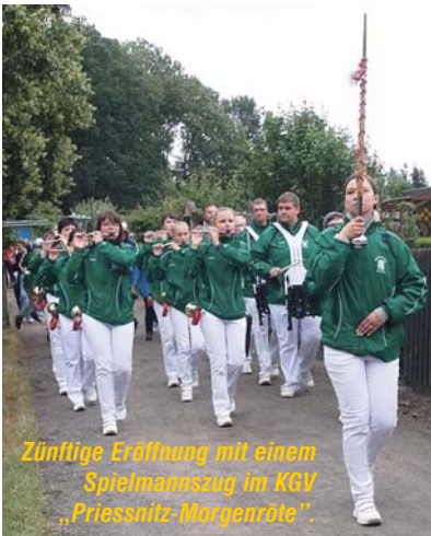
Zünftige Eröffnung mit einem Spielmannszug im KGV „Priesnitz-Morgenröte“.