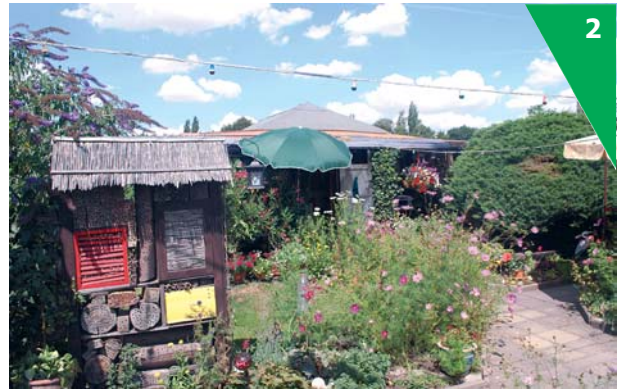
Vielfältige naturnahe Gartengestaltung ist eine solide Grundlage für die Entwicklung des KGV zu einem „Leuchtturm“.