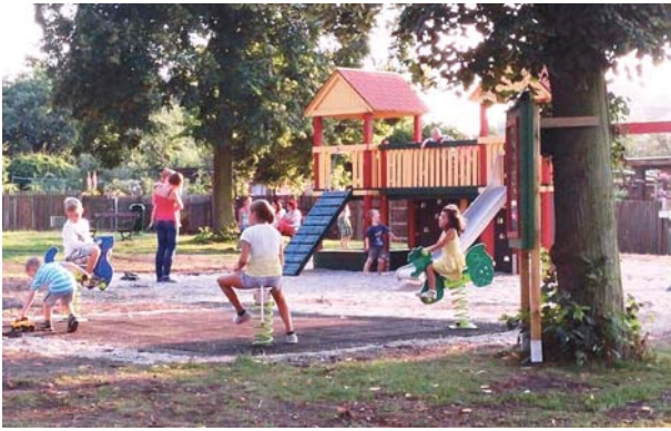
Öffnung und Durchwegung der KGA, Ruhezonen und Kinderspielfläche können einige „Bausteine für den Leuchtturm“ KGV sein.