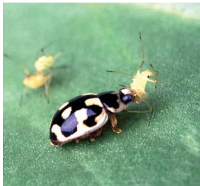
Ein 14-Punkt-Marienkäfer lässt sich eine Blattlaus schmecken.

Die immense Bedeutung der Insekten und ihre unglaubliche Vielfalt werden von uns Menschen kaum wahrgenommen und nur selten gewürdigt. Die schiere Arten-Übermacht von (in Deutschland) etwa 175 Tagfalterarten, 3.000 Nachtschmetterlings-, 6.000 Käfer-, je 80 verschiedenen Libellen- und Heuschrecken-, je 1.000 Wanzen- und