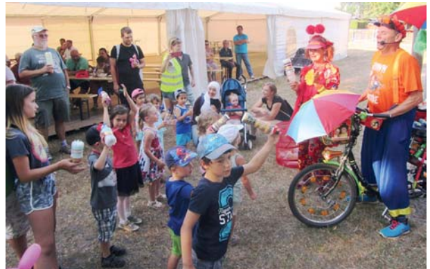
120 Jahre „Naturheilverein Leipzig III“: Kinder sind immer gute Mitspieler.