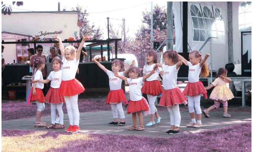
Die eigens engagierte Kindertanzgruppe kam im KGV „Sommerheim“ gut an.