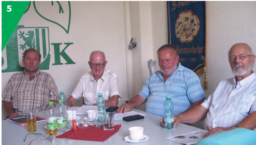
Die Schlichtergruppe des SLK braucht dringend Verstärkung.