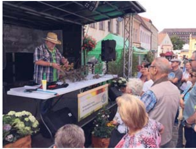
Der Fachmann zeigt, wie's geht.

Die Torgauerin, die sich selbst als Gartenfanatikerin bezeichnet, hat zu Hause ganz frisch gekaufte Apfel-, Mirabellen-, Pfirsich- und Kiwibäume stehen, bei denen im nächsten Jahr ein Baumschnitt fällig ist. Erworben hat sie die Pflanzen beim Gärtner ihres Vertrauens und damit hat sie alles richtig ge-