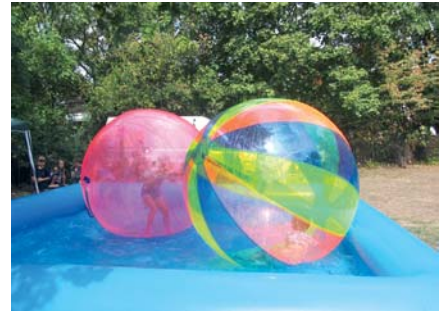
Ungewöhnlicher Wasserspaß für Kinder im KGV „An der Dammstraße“.

Pünktlich zum Herbstbeginn ging dem unendlich erscheinenden Sommer 2018 dann doch die Puste aus. Die Redaktion nimmt das zum Anlass, zurückzublicken auf die Kinder- und Sommerfeste, die in vielen Kleingärtnervereinen noch immer eine gute Tradition sind. So fanden z.B. in den Monaten Juli und August in mehr als 50 Vereinen solche Höhepunkte statt. Da wir leider nicht von allen berichten konnten, soll diese kleine Bildauswahl an die schöne Zeit der Kinder- und Sommerfeste erinnern und schon Appetit auf die Veranstaltungen im kommenden Jahr machen.