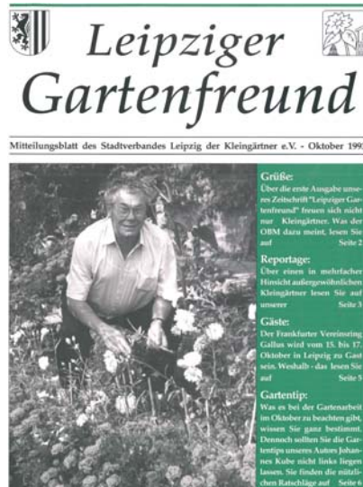
Die erste Ausgabe des „Leipziger Gartenfreundes“.

Im Oktober 1993 ist die erste Ausgabe des „Leipziger Gartenfreundes“ erschienen. Dazwischen liegt ein Vierteljahrhundert, in dem sich allerhand getan hat. Begonnen hatte es allerdings viel früher. Bereits auf dem ersten Verbandstag der Leipziger Kleingärtner im September 1990 wurde über die Herausgabe einer Verbandszeitung beraten. Zunächst sollte eine gemeinsame Zeitung mit den Gartenfreunden des Bezirksverbandes Hannover herausgegeben werden. Im April 1991 erschien eine Ausgabe mit dem Titel „Garten und Familie in Hannover und Leipzig“. Da in diesem Zusammenhang der Mitgliedsbeitrag erhöht werden sollte, kam das Projekt über den Anfang nicht