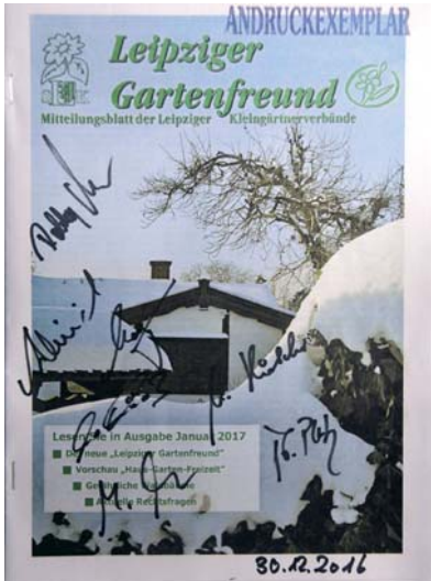
Das Andruckexemplar des neuen „Leipziger Gartenfreundes“ für den Januar 2017.

Das änderte nichts daran, dass 2016 Überlegungen für eine weitere Umstellung notwendig wurden. Bis dahin gab es von der Stadt Leipzig eine finanzielle Förderung für unser Mitteilungsblatt, die jedoch ab 2017 aus verschiedenen Gründen nicht weiter gewährt wurde. Wieder mussten neue Wege gefunden werden. Darum kümmern sich der Vorstand des SLK und das Redaktionsteam.