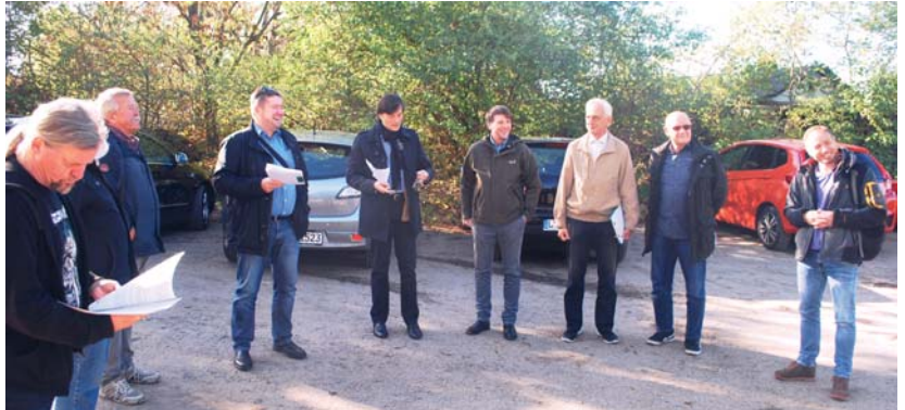
Vor-Ort-Gespräch auf dem Parkplatz des KGV „Lerchenhain“

Erste Station war die KGA „Lerchenhain“. Hier gibt es ein Problem mit der Zufahrt zum vereinseigenen Parkplatz. Diese verläuft über drei Grundstücke und ist nicht ganz einfach zu befahren. Trotzdem wollen einige der privaten Eigentümer mittlerweile dafür Geld haben. Damit ist die Nutzung des recht ansehnlichen Vereinsparkplatzes in Gefahr, eine Ausweidlösung muss gesucht