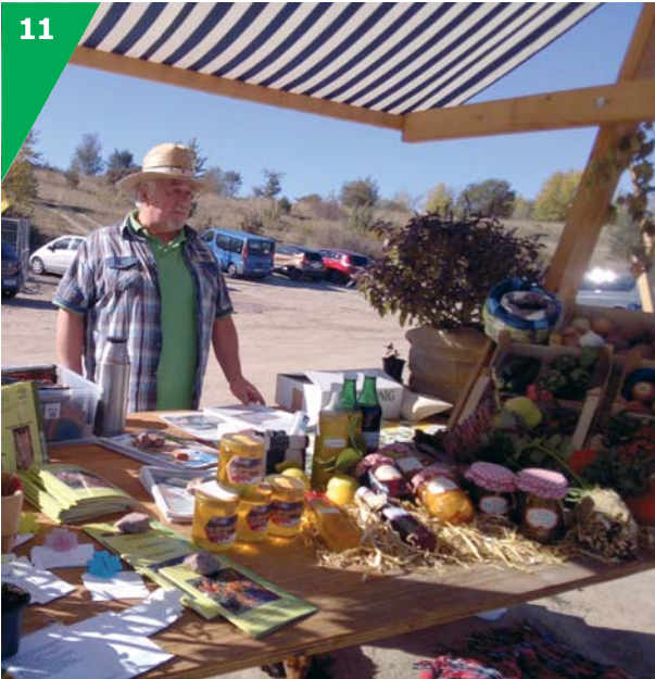
Der Autor am Stand des KGV „Flughafenstraße“.