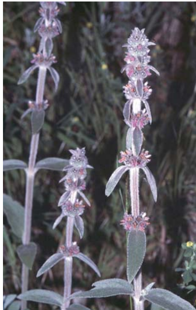
Ziest ist ein attraktiver Bodendecker.

Cadmos VI. 2018, 224 S., Broschur m. Spiralheftung, 15 cm x 21 cm, ISBN 978-3840475665, 10,95 EUR