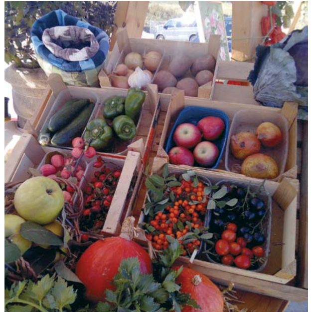
Erntefrische Angebote direkt aus den Kleingärten.