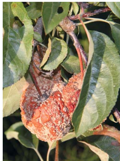
Fallobst und Fruchtmumien müssen entfernt werden, denn sie bieten vielen Krankheitserregern ideale Überwinterungsbedingungen.

darauf nisten sich verschiedene Schadpilze, wie u.a. Schorf, Monilia, Zwetschenrost, Kragefäule, Sprühfleckenkrankheit der Kirsche, ein und überstehen so die frostige Winterzeit. Die Schadpilze entwickeln sich auf dem abgefallenen Laub und dem Obst und bilden Fruchtkörper aus. Bei Beginn des Pflanzenwachstums, steigenden Temperaturen und ausreichender Feuchtigkeit platzen die Fruchtkörper auf und schleudern ihre Sporen in alle Richtungen. So werden junge Blätter, Triebe und Blüten schnell infiziert. Natürlich kann man nicht jedes einzelne Blatt und jede gefallene Frucht beseitigen, sollte aber sein Möglichstes tun, um den Infektionsdruck einzuschränken, damit man einige Spritzungen vermeiden kann.