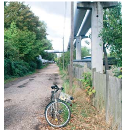
In der Zufahrt zur KGA „Abendsonne“ ist das Abstellen von PKW verboten.

Im Zusammenhang mit dem Bau der Reihenhäuser im Bereich Brauereistraße/Kunzestraße sind Parkmöglichkeiten für die Kleingärtner verloren gegangen. Entferntere Abstellmöglichkeiten nutzen vor allem ältere Gartenfreunde wegen des längeren Fußmarsches nicht. Deswegen werden PKW verstärkt in den Zufahrtswegen zu den KGA abgestellt, was vom Ordnungsamt geahndet wird. Einige Gartenfreun-