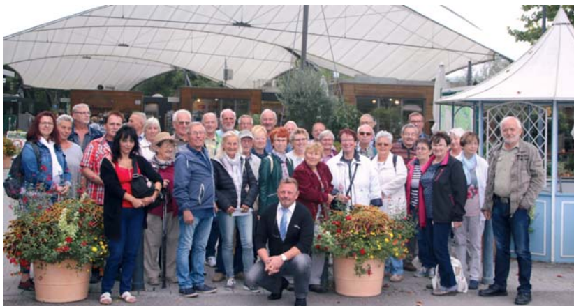
Die gutgelaunten Teilnehmer der Schulungsfahrt.

Im Rahmen der Führung auf der Insel Mainau gab es z.B. Installationen und Pflanzungen, die die Mainau-Gärtner passend zum Jahres-