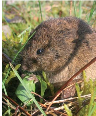
Niedlich und nervig – Mäuse im Garten.

Fuchs und wilde Katzen. Ein Stein- und Totholzhaufen sowie andere Hohlräume in einer ruhigen, teilweise verwilderten Ecke im Garten bieten den Feinden Lebensraum und wirken sich positiv aus. Ein naturnaher Kleingarten hält Wühlmäuse auf Distanz, da deren Nahrungs-