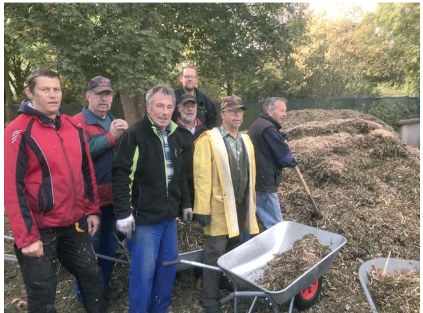
Ein Riesenberg Häcksel blieb von den „falschen“ Anpflanzungen übrig.