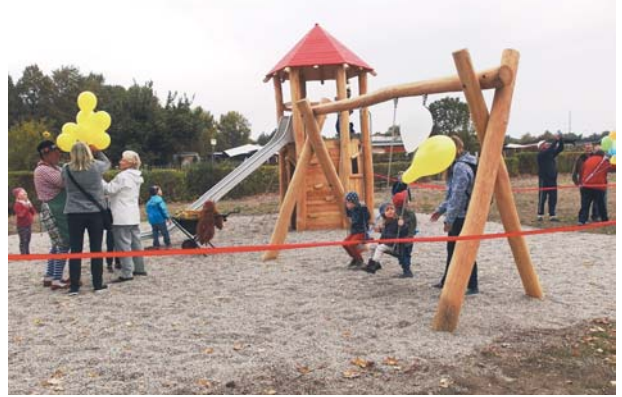
Öffentlich zugängliche Kinderspielplätze können finanziell gefördert werden.