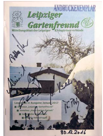
Historisches Zeugnis: Die Ausgabe Januar 2017 des Leipziger Gartenfreundes war das erste in Leipzig-Stahmeln gedruckte Exemplar im Format „nordisch-halbtaloid“.

Übrigens: Das Redaktions-Team des „Leipziger Gartenfreundes“ hat die bevorstehenden Veränderungen zum Anlass genommen, die Gestaltung des Heftes im Detail ein wenig zu optimieren und einige Anregungen unserer Leser umzusetzen. Sie dürfen also gespannt sein auf den neuen „Leipziger Gartenfreund“. -r