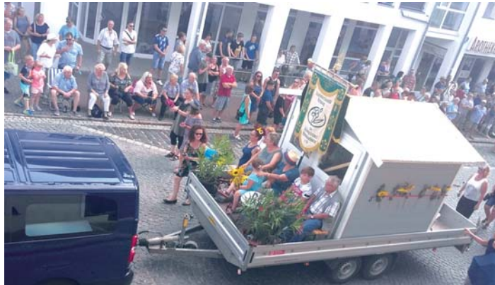
Der Festwagen des Kreisverbandes beim diesjährigen Tauchscher.

Kleingärtnervereine sollten im Interesse der Öffentlichkeitsarbeit und zur Erhöhung ihres Bekanntheitsgrades nach Möglichkeit für die Anwohner im Einzugsbereich ihrer Anlage auch eine Fachberatung anbieten. Die Messe „Haus-Garten-Freizeit“ erreicht alljährlich zwar viele Bürger, dabei nach ei-