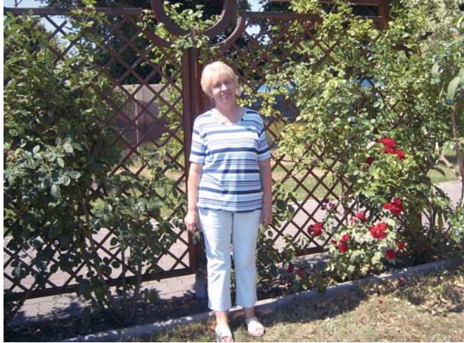
Die Autorin in ihrem grünen Paradies, hier auf einem Archivbild.