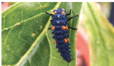
Eine Marienkäferlarve.

Marienkäfer sind nicht nur rot mit schwarzen Punkten. Es gibt auch gelbe und andersfarbige. Zahl und Größe der Punkte können variieren. Wichtig ist es, die Larven zu erkennen. Sie schlüpfen aus gelben, senkrecht aufgestellten Eiern, sind dunkel graublau gefärbt und gelb gepunktet. Wenn sie sich verpuppen, rollen sich diese Larven kugelförmig zusammen. Dann hängen sie an „Füßchen“ an Blättern oder Stängeln. Sie sind an den ruckartigen Bewegungen zu erkennen, wenn man sie berührt. Käfer und Larven fressen vor allem große Mengen Blattläuse. Was den Marienkäfer so bemerkenswert macht, denn eine Larve vertilgt während ihrer 20-tägigen Lebenszeit 350 bis 400 der kleinen Schädlinge. Nach der Winterruhe sind Marienkäfer besonders hungrig. Beim Anblick der ersten Läuse Ruhe bewahren, bis die Marienkäfer auftauchen.