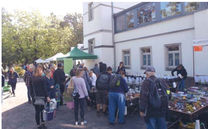
Die 13. Auflage des Pflanzenmarktes war gut besucht. Wie immer waren auch unsere Fachberater mit einem Stand vertreten.

Die Resonanz auf diesen zweitägigen Pflanzenmarkt war sehr gut, resümierten die Gartenfachberater der SLK. Und auch 2020 wird es wieder im Frühjahr und zu Beginn des Herbstes je einen Pflanzenmarkt geben. -r