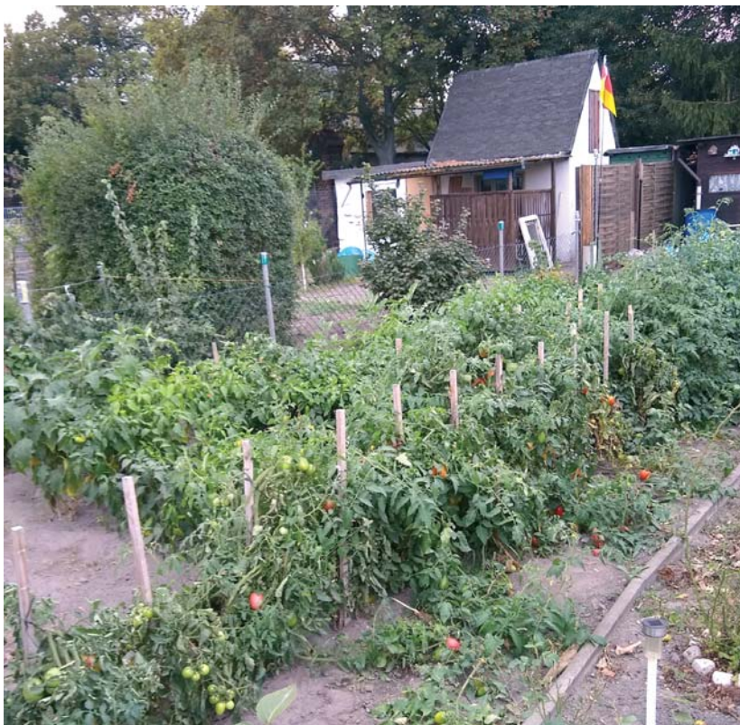
Diese Parzelle wird intensiv kleingärtnerisch genutzt.