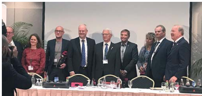
Das neue Präsidium des Bundesverbandes Deutscher Gartenfreunde.