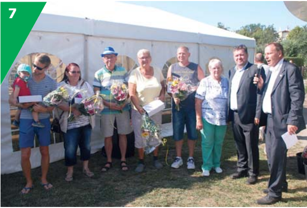
Zehn Gartenfreundinnen und Gartenfreunde wurden vom Vorstand des KGV mit Ehrennadeln und „Goldenen Spaten“ ausgezeichnet.