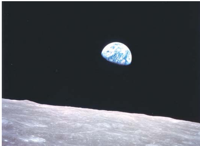
Der Mond beeinflusst die Erde in mancherlei Hinsicht. Maria Thun hat herausgefunden, dass das auch fürs Pflanzenwachstum gilt.

Der Neumond ist keine gute Zeit zum Säen. Er steht für den Beginn und daher sollten in dieser Phase nur Arbeiten ausgeführt werden, die der Pflege zugehören. Auch die Tierkreiszeichen spielen diesbezüglich eine Rolle, zu welchem Zeitpunkt der Mond durch das