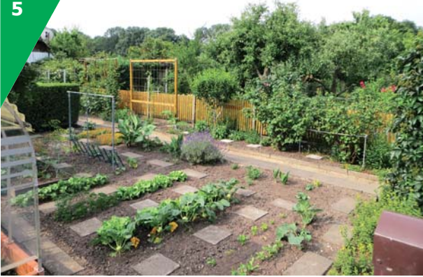
Die erkennbare kleingärtnerische Nutzung ist ein wichtiges Kriterium für den Fortbestand der Anlage.