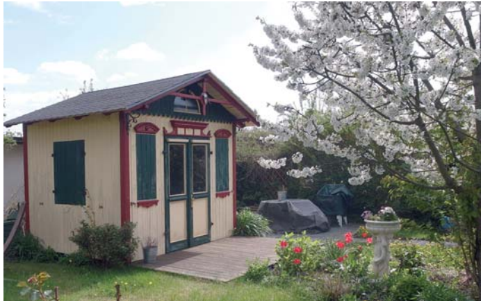
Die historische „Krause-laube“ wird erhalten und gut gepflegt.

In den Jahren des Ersten Weltkrieges ging es vor allem um den Anbau von Gemüse. Ab 1918 nutzten die Mitglieder Brachland der am Weg liegenden „Brandt's Aue“ als Grabeland für den Kartoffelanbau. Dort gründete sich 1921 der heutige „Schreberverein Westgohliser Gartenkolonie“.