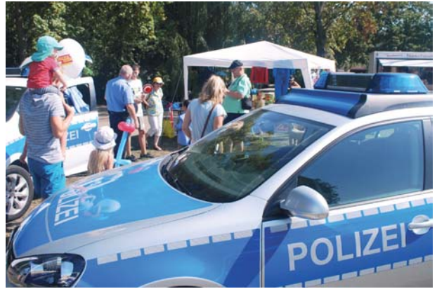
Bei der Präsentation der Polizeidirektion Leipzig gab es „Polizei zum Anfassen“.