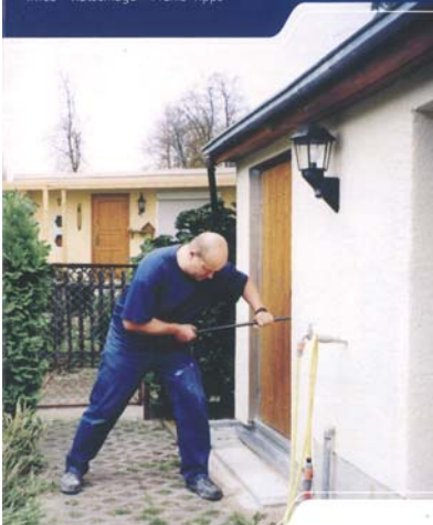
Diese Broschüre gibt preisgünstige Tipps für mehr Sicherheit.