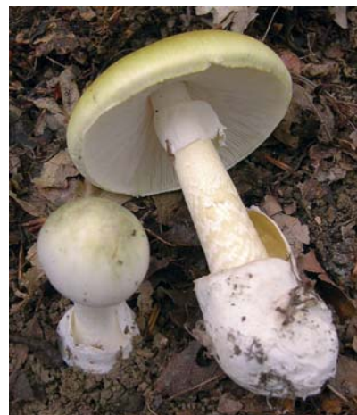
Schön und gefährlich: der Grüne Knollenblätterpilz.

Die freien Lamellen an der Unterseite des Hutes sind weißlich gefärbt. Der Stiel ist bis ca. 10 cm