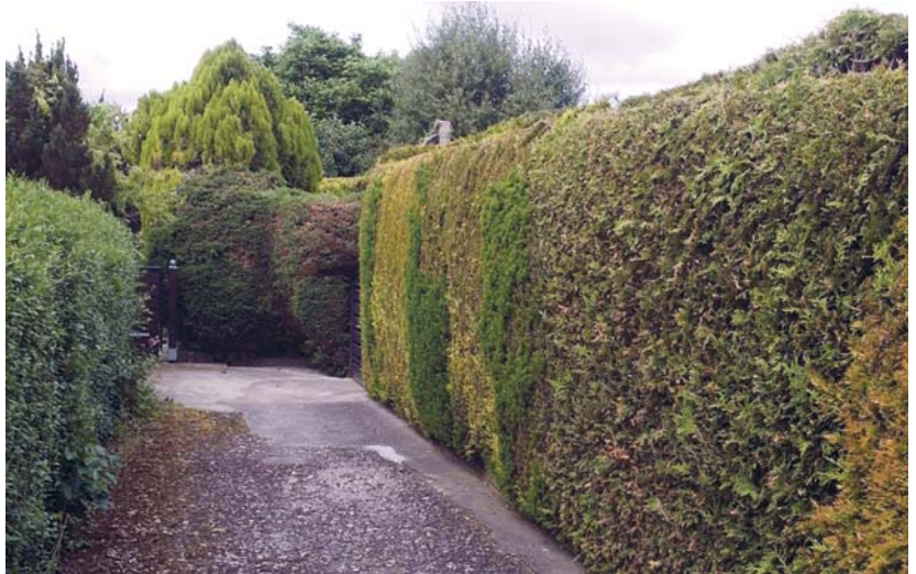
So hohe Hecken schützen nicht, sondern geben Einbrechern Deckung und sind damit ein Sicherheitsrisiko.

So sollte z.B. das Laub von der Wiese entfernt und auf den Beeten verteilt werden. Beerensträucher müssen nicht unbedingt geschnitten werden. Vögel freuen sich über die restlichen Früchte ebenso wie über ein paar Sonnenblumen, die ihnen etwas Futter bieten. Ein Totholz- oder Reisighaufen in einer Gartenecke bietet Unterschlupf für viele Lebewesen. Wer im Winter im Garten Vögel